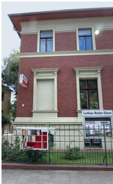
Das Lothar-Bisky-Haus in Potsdam: Rechtzeitig zur Bundestagswahl wird die Parteizentrale der Brandenburger LINKEN äußerlich in Szene gesetzt, um Wählern und Wettbewerbern ein starkes Kampfsignal zu senden.

DIE LINKE Brandenburg wird für die Zeit des Wahlkampfes eine Wahlfabrik außerhalb des Lothar-Bisky-Hauses in der Zeppelinstraße 7 in der Nähe des Luisenplatzes in Potsdam ein-