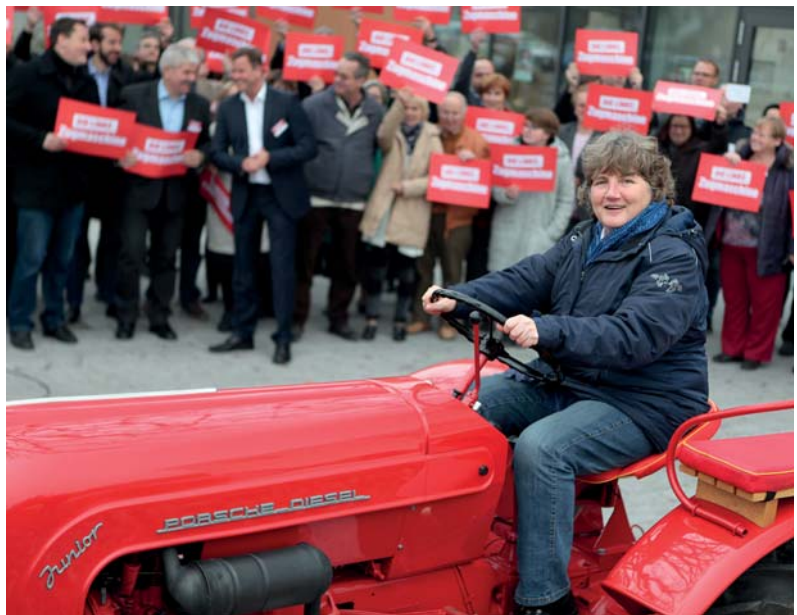
Unsere »Zugmaschine« für die Bundestagswahl 2017: Kirsten Tackmann

Das ist eine große Chance, gerade für uns LINKE. Wir wollen ja nicht nur möglichst viele Stimmen gewinnen, damit wir noch mehr Druck machen können für eine friedliche, solidarische und sozial gerechte Gesellschaft, die respektvoll mit der Natur umgeht. Sondern wir wollen Verbündete finden, die auch nach der Wahl an unserer Seite bleiben, im günstigsten Fall Mitstreiterinnen und Mitstreiter werden. Uns geht es doch um viel mehr als eine Wahlentscheidung. Lothar Bisky hat es gesagt: Ja, wir stellen die Systemfrage. Weil wir als LINKE nicht nur Symptome lindern, sondern die Ursachen der vielen großen und kleinen Probleme im Alltag vieler Menschen beseitigen wollen. Aber das geht nur mit ihnen gemeinsam. Egal, ob beim Widerstand gegen das unüberhörbare, unerträgliche Säbelraseln. Oder ob wir das Recht auf ein Le-